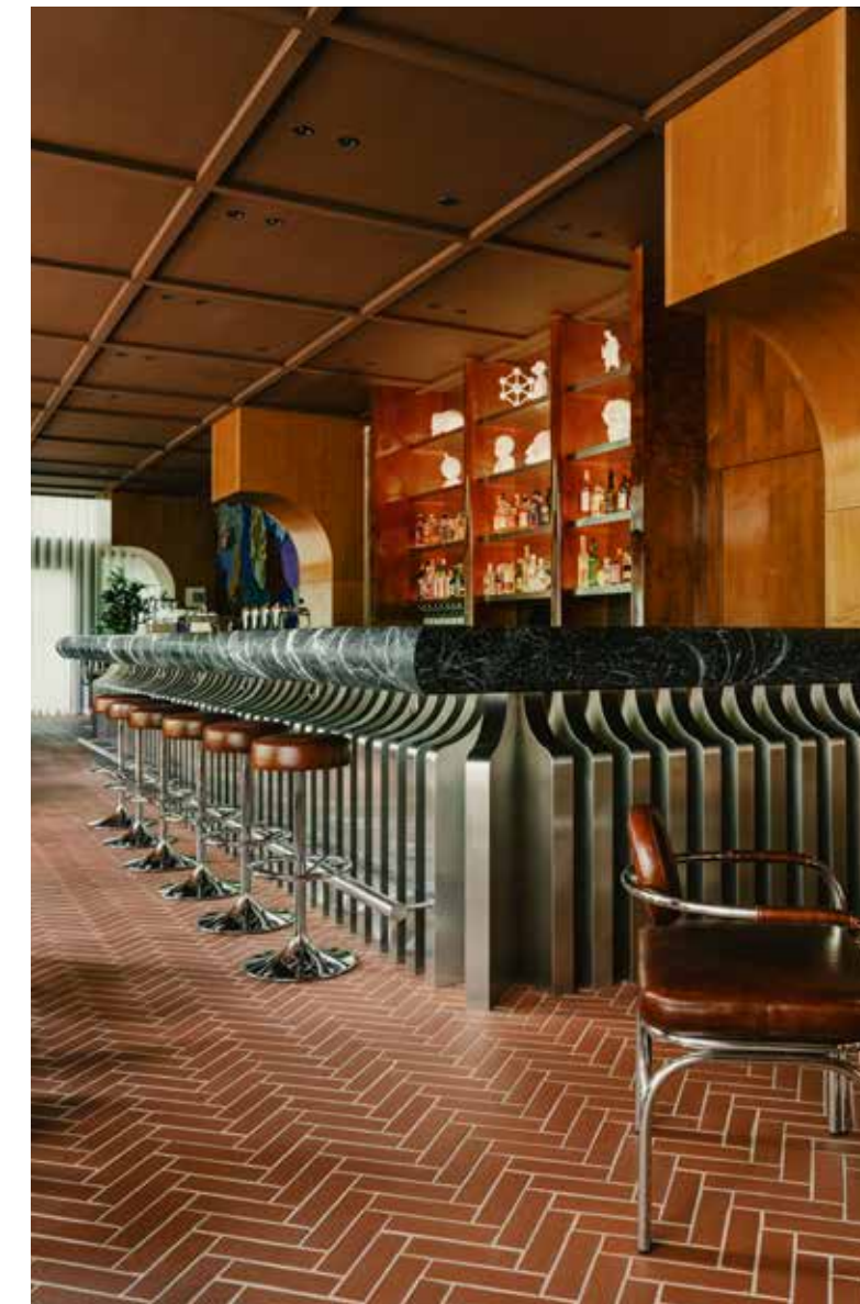
The Standard Brussels Hotel, Médoc 220x60x12