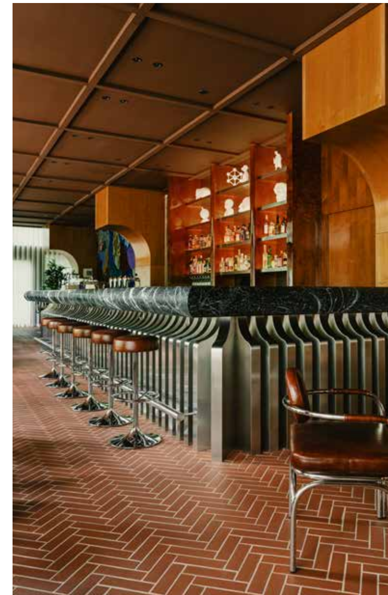
The Standard Brussels Hotel, Médoc 220x60x12